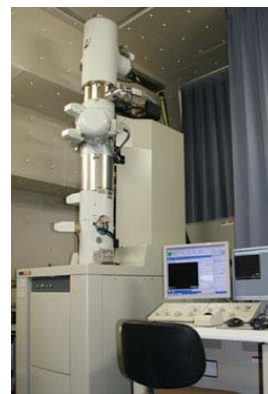
球面収差補正透過電子顕微鏡 JEM-2200FS

本講習会では、球面収差補正透過電子顕微鏡 JEM-2200FS の利用について、講義と実習による講習を行います。対象は、電子顕微鏡での微細構造解析を必要とされている、もしくは検討されている、研究者ならびに大学院生となります。学外・学内は問いません。設備の関係上、参加人数を制限させていただきますので、お早めにお申込みいただきますようお願いいたします。