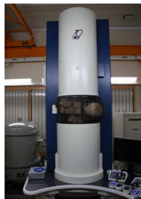
モノクロメータ搭載 低加速原子分解能分析電子顕微鏡 JEM-ARM200F

本講習会では、モノクロメータ搭載低加速原子分解能分析電子顕微鏡 JEM-ARM200F の利用について、講義と実習による講習を行います。対象は、電子顕微鏡での微細構造解析を必要とされている、もしくは検討されている、研究者ならびに大学院生となります。学外・学内は問いません。設備の関係上、参加人数を制限させていただきますので、お早めにお申込みいただきますようお願いいたします。