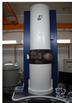
モノクロメータ搭載 低加速原子分解能分析電子顕微鏡 JEM-ARM200F

本講習会では、モノクロメータ搭載低加速原子分解能分析電子顕微鏡 JEM-ARM200F の利用について、講義と実習による講習を行います。対象は、電子顕微鏡での微細構造解析を必要とされている、もしくは検討されている、研究者ならびに大学院生となります。学外・学内は問いません。設備の関係上、参加人数を制限させていただきますので、お早めにお申込みいただきますようお願いいたします。